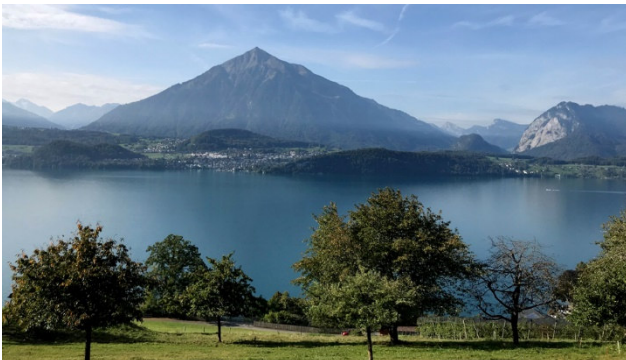
Hotel-Aussicht auf den Niesen

Unsere immer beliebte Reise über den Schweizer «Geburtstag» führt Sie dieses Jahr ins schöne Berner Oberland auf die Sonnenterrasse Sigriswil oberhalb des Thunersees. Auf einer abwechslungsreichen Route im bequemen Rattin-Car fahren Sie durch die sommerliche Schweizer Landschaft. Eingekehrt wird in gutbürgerlichen Landgasthäusern mit währschafter Küche und tollem Service. Eine Schifffahrt auf dem malerischen Thunersee sowie eine spannende Besichtigung im Museum für historische Zeit dürfen nicht fehlen. Am Abend werden Sie im Hotel Bären in Sigriswil empfangen und verwöhnt. Kommen Sie mit auf diese schöne Zweitagesreise!