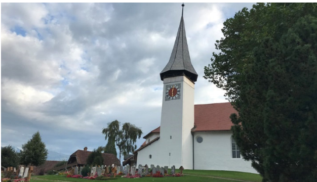
Kirche von Sigriswil