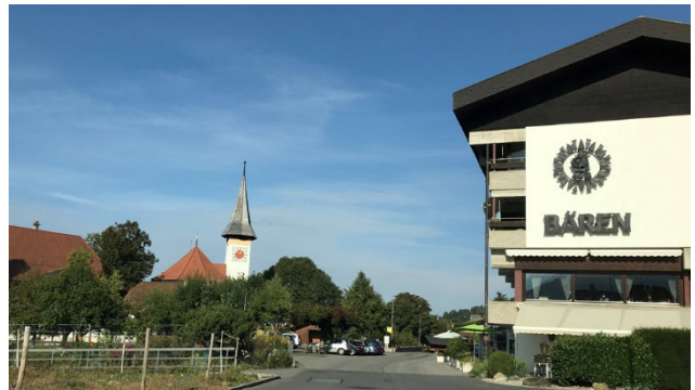
Hotel Bären in Sigriswil