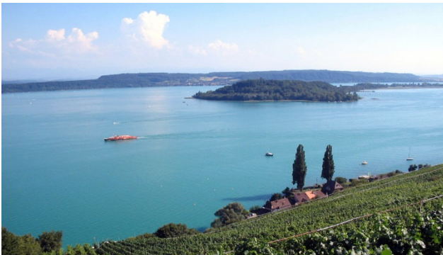
Bielersee mit St.Petersinsel

Das kleine mittelalterliche Murten am Südostufer des gleichnamigen Sees hat sein ursprüngliches Gesicht durch die malerischen Altstadt-Gassen und die gemütlichen Laubengänge erhalten. Die Stadt an der deutsch-französischen Sprachgrenze besitzt eine schöne Seepromenade, von welcher aus Sie am Abend die Feuerwerke bestaunen können.