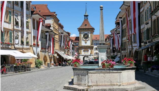
Ortszentrum von Murten