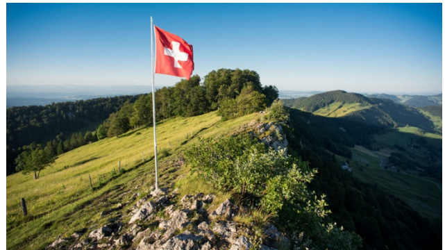
Vogelberg bei Mümliswil und in der Nähe vom Passwang