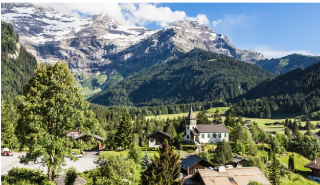
Bergdorf Les Diablerets