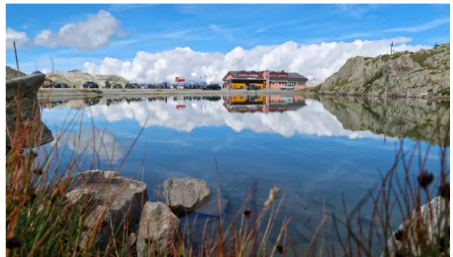
Zuoberst auf dem Nufenen