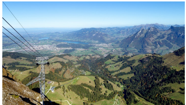
Aussicht vom Moléson