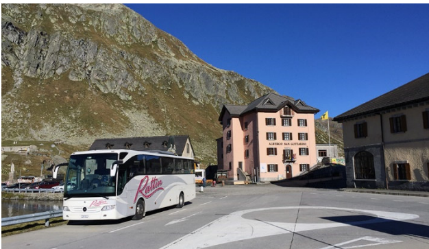
Auf dem Gotthard-Pass

Berge, Seen und Bilderbuchlandschaften prägen das Image der Schweiz – zu Recht, denn kaum ein Land hat derartig schöne Alpenlandschaften zu bieten wie unsere Heimat. Geniessen Sie mit uns zwei unvergessliche Tage über den Nationalfeiertag. Sie überqueren mit dem Rattin-Car fünf Pässe, passieren zahlreiche blumengeschmückte Dörfer und durchqueren wunderschöne Regionen.