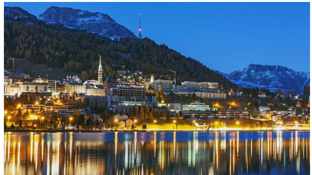
Abendstimmung in St. Moritz