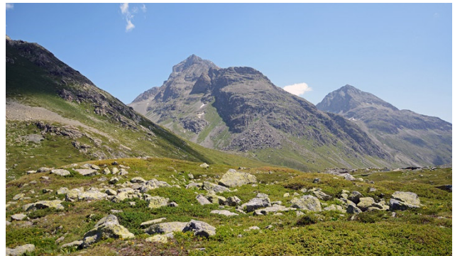
Auf dem Julierpass mit Piz Julier und Piz Albana