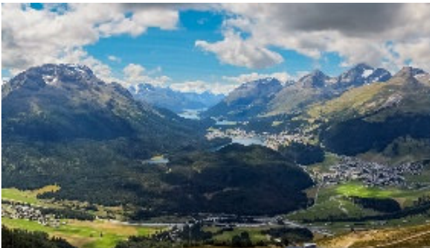
Aussicht vom Muottas Muragl

Die Rückreise wird mit einer abwechslungsreichen Fahrt über Zernez, den Flüelapass, durch das Landwassertal und einem Aufenthalt in der Hauptstadt Graubündens aufgelockert.