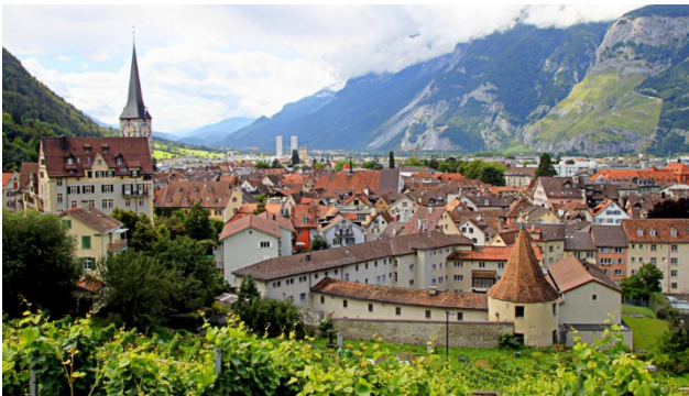
Älteste Stadt Chur verzaubert mit historischen Gebäude