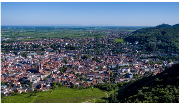
Neustadt an der Weinstrasse