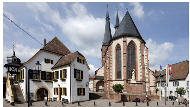
Deidesheim mit Marktplatz, Kirche und Rathaus