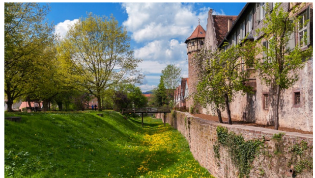
Michelstadt im Odenwald