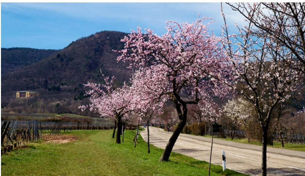
Mandelblüte in Rheinland-Pfalz

In der Südpfalz, wo sich Wald und Weinberge an der Deutschen Weinstrasse treffen, erwacht die Natur immer ein wenig früher als anderswo. Während andernorts noch Wintergrau vorherrscht, schieben sich hier bereits rosarote Blütenwolken durch die Region. Die märchenhafte rosa Lichtsinfonie geben das Startzeichen für eine Reise in den Frühling.