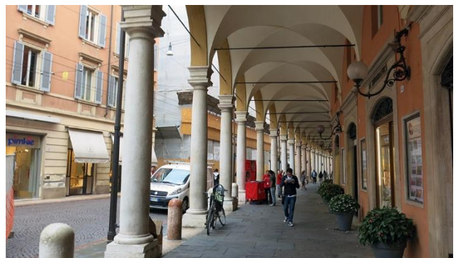
Arkaden in Modena