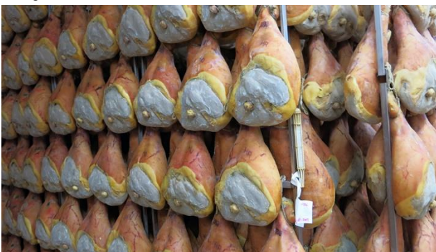
Der bekannte Parmaschinken