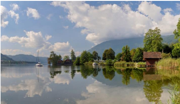
Naturparadies Ossiacher See

Mediterran angehauchtes Klima und eine wahre Vielfalt erwarten Sie in Österreichs südlichem Bundesland. Lassen Sie sich bezaubern von der wahrscheinlich schönsten Landschaft des Alpenstaates. Nationalparks, die Nockberge und Bergseen mit glasklarem Wasser laden ein zum Genießen. Daneben findet man in Kärnten auch alte Städtchen, versteckte Bergdörfer oder urbane Zentren wie Klagenfurt oder Villach. Am Wörther See pulsiert das Leben. Auf dem Lande hingegen, so auch in Ihrem schönen Hotel in Steindorf am Ossiacher See, finden Sie viele traumhaft ruhige Plätzchen.