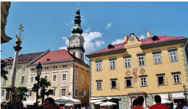
Urbanes Zentrum Klagenfurt