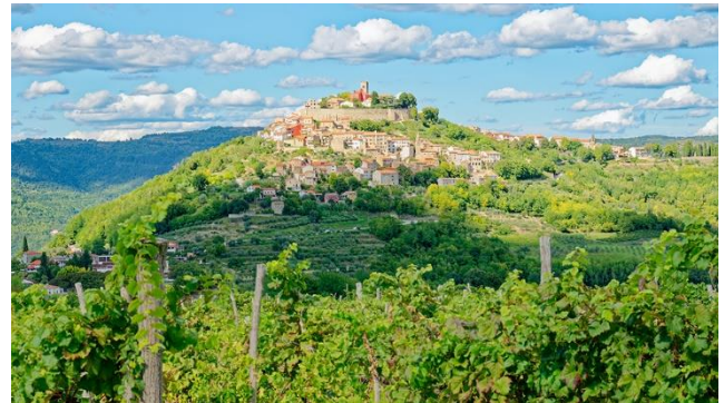
Motovun – Perle von Zentralistrien