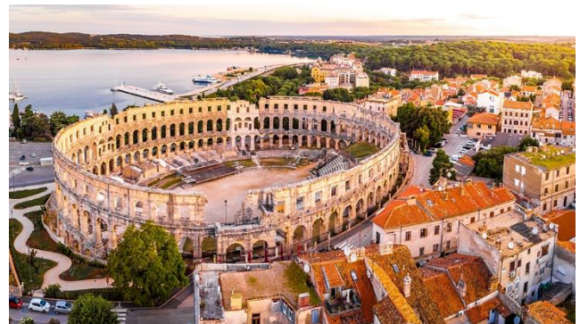
Das imposante Amphitheater von Pula