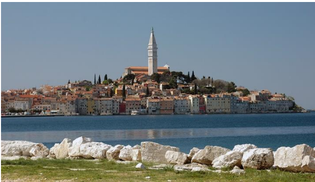
Schönes Panorama mit Rovinj