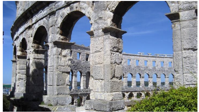
Amphitheater in Pula