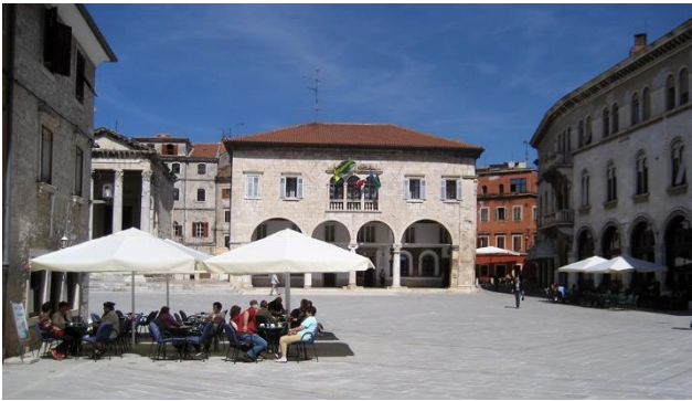
Einladende Plätze in der Altstadt von Pula

Istrien ist auch bekannt als touristische Perle des Mittelmeerraumes, deren Geschichte bis in antike Zeiten zurückreicht. Während des Römischen Reiches wurden viele Städte und Festungen gegründet, wovon zahlreiche Denkmäler zeugen, von denen das wunderschön erhaltene Amphitheater in Pula jedoch das bedeutendste Wahrzeichen ist. Istrien ist heute die beliebteste Region Kroatiens, weithin bekannt auch für seine Naturschönheiten.