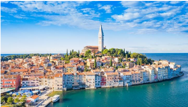
Romantisches Städtchen Rovinj

Romantische Städtchen, die Meeresbrise im Gesicht, malerische Natur entlang der Küste und feinste Spezialitäten auf dem Teller, das ist Istrien – die Perle am Mittelmeer. Istrien ist die beliebteste und bekannteste Region Kroatiens, deren Geschichte bis in antike Zeiten zurückreicht. Auf dieser Reise werden kulinarische Genüsse, schönste Architektur, atemberaubende Landschaften und ein wenig Kultur auf Sie warten. Ebenso werden Sie an der Adria Zeit finden, die Seele baumeln zu lassen und sich zu entspannen.