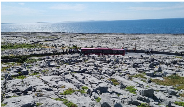
Im Burren gebiet

Nach der eindrücklichen Besichtigung fahren Sie an die Westküste nach Ennistymon. Abendessen und Übernachtung im Falls Hotel and Spa.