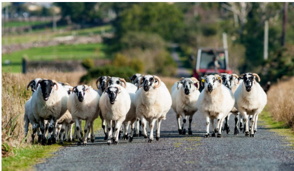
Schafherden sind auf der ganzen Reise präsent...