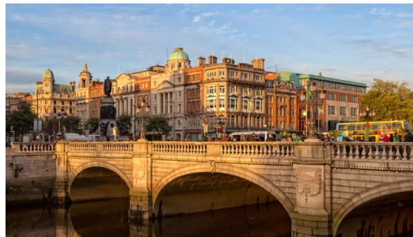
Dublin – die Hauptstadt Irlands