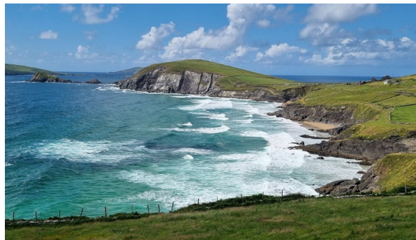
Aussicht von der Dingle Halbinsel