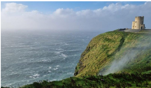
Cliffs of Moher

Wir freuen uns, Ihnen auf dieser Reise die «Grüne Insel», mit ihren grossartigen Sehenswürdigkeiten, bezaubernden Ortschaften und Naturschönheiten zeigen zu dürfen. Die Offenheit der Bevölkerung ist bekannt und trägt viel zum positiven Eindruck bei. Es ist eine einmalige Gelegenheit Irland kennenzulernen! Die Reise führt quer durch das Landesinnere, weiter im Westen der Insel, entlang den Küsten und wieder zurück nach Dublin. Ruinen, keltische Klöster und die Burgen normannischer Herren säumen den Weg, eindrucksvolle Moorlandschaften, klare Seen, saftig grüne Weiden geben ein reichhaltiges Bild dieser Insel. Lassen Sie sich von dem irischen Humor anstecken und geniessen Sie die herrlich optimistische, irische Lebensart!