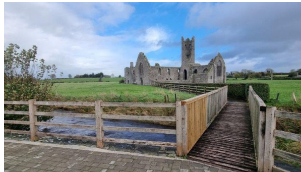
... wie auch Spuren aus längst vergangener Zeit