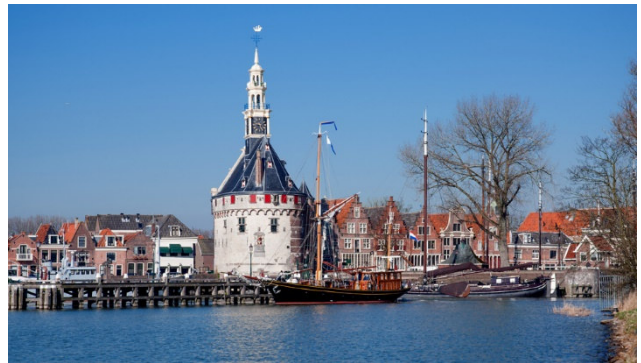
Hoorn am Ojsselmeer