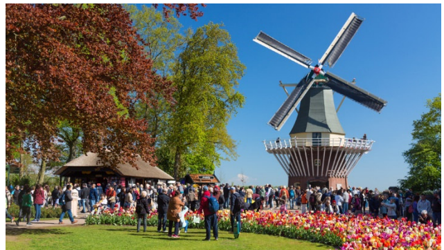
Farbenpracht im Keukenhof