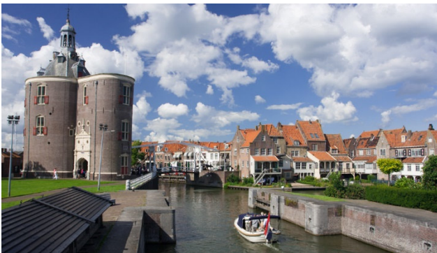
Freizeit in der Ortschaft Enkhuizen