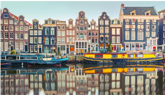
Häuserfassade in Amsterdam

Diese Reise führt Sie nach Amsterdam, Nordholland und zum Keukenhof. Keukenhof? Das ist der Ort, wo der Frühling zum Blühen kommt. Der Park ist schon seit sechzig Jahren eines der populärsten Reiseziele Hollands. Amsterdam, die Hauptstadt der Niederlande, ist eine tolle Metropole mit ihren engen Gässchen, den unzähligen Grachten und dem lebhaften Treiben. In Nordholland treffen Sie auf das typische Holland – das heisst Windmühlen, Käse, Grachten, Holzschuhe und Fahrräder.