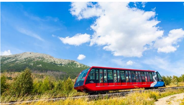
Zahnradbahn zur Bergstation Hrebienok

Heute haben Sie die Wahl: Geniessen Sie die Annehmlichkeiten des Hotels mit dem schönen Wellness und Spa-Bereich oder kommen Sie mit uns auf Entdeckungstour in den Nationalpark Pieniny. Von den Goralen wird Ihnen heute die Schönheit des Dunajec nähergebracht. Auf einer romantischen Flossfahrt schiffen Sie 12 Kilometer auf dem Dunajec flussabwärts. Die traditionellen Flosse aus Holz sind ein rustikales Fortbewegungsmittel, das Sie auf einfachen Holzbänken befördert (Selbständiges Ein- und Aussteigen, eine Grundfitness sowie ein sicherer Stand werden für eine Mitfahrt vorausgesetzt). Nach dieser Fahrt durch den Nationalpark besuchen Sie das Kloster Cerveny. Das Kloster ist bekannt für seine beachtenswerte Apotheke, die sich rund um die Heilpflanzenkunde dreht. Anschliessend Fahrt zurück zum Hotel. Lassen Sie den Tag Revue passieren und geniessen Sie einmal mehr das Abendessen im Hotel.