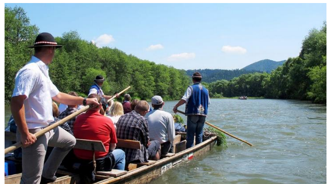
Flossfahrt auf dem Dunajec