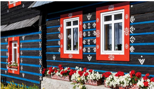
Bauernhäuser in Zdiar