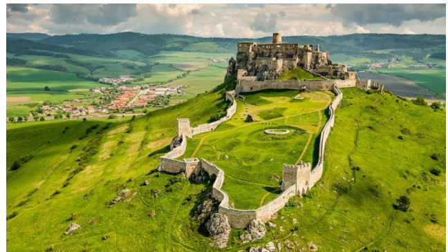
UNESCO-Kulturerbe Zipser Burg