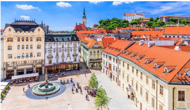
Bratislava – die Hauptstadt der Slowakei

Einmalige Burgen, Flussromantik, europäische Wildnis, Nationalparks, schmucke Städte, Berge mit Winter- und Wandergebiete und gutbürgerliches Essen. All diese Eigenschaften zeichnen die Slowakei, das noch unbekannteste Land im Herzen Europas aus. Kommen Sie mit uns ins Naturparadies Hohe Tatra, dem populärsten Ziel der Slowakei. Nicht nur die Naturschönheiten des bis zu 2655 Meter hohen Gebirgszuges, sondern auch das UNESCO-Welterbe Zipser Burg machen aus der Tatra eine attraktive Destination. Ebenso wenig darf ein Besuch in der slowakischen Hauptstadt Bratislava, gelegen an der schönen Donau, wie ein Ausflug in den Nationalpark Pieniny mit einer Flossfahrt auf dem Grenzfluss Dunajec, fehlen. Entdecken Sie mit uns diesen Geheimtipp – Sie werden begeistert sein.