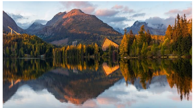
Gletschersee Tschirmer See