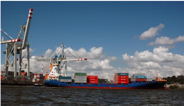
Hamburger Hafen mit Frachtschiffen