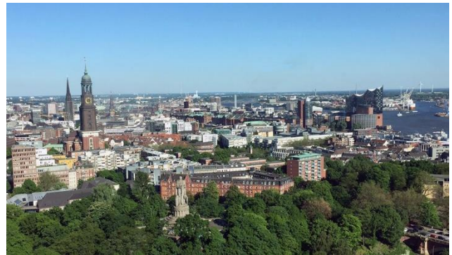
Hamburg von oben