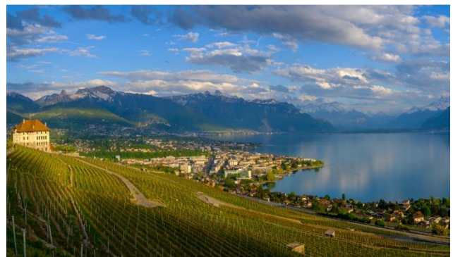
Einmalige Sicht auf den Genfersee