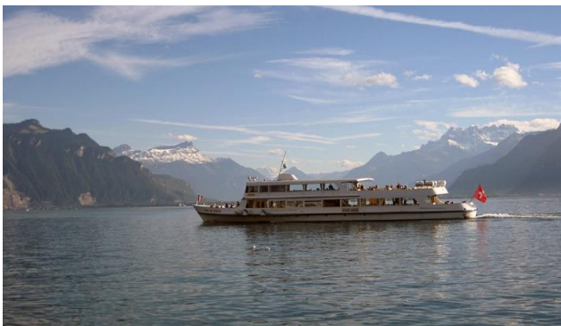
Schifffahrt auf dem Genfersee

Von Montreux fährt der Golden Pass hinauf nach Les Avants mit grandioser Aussicht auf den Genfersee und die terrassenförmigen Weinberge. Dann folgt das Pays d'Enhaut – Château-d'Oex und weiter geht es an bekannten Orten wie Gstaad und Saanenmöser vorbei nach Zweisimmen, das Ziel der Bahnreise! Weitere Höhepunkte dieser Reise sind die Schifffahrt auf dem Genfersee und die Bahnfahrt auf die Schynige Platte.