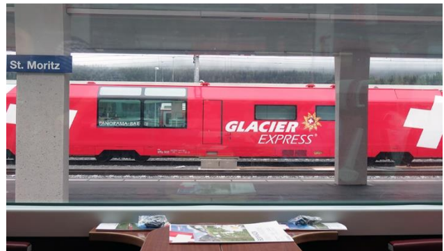
Einfahrt des Glacier Express in St. Moritz