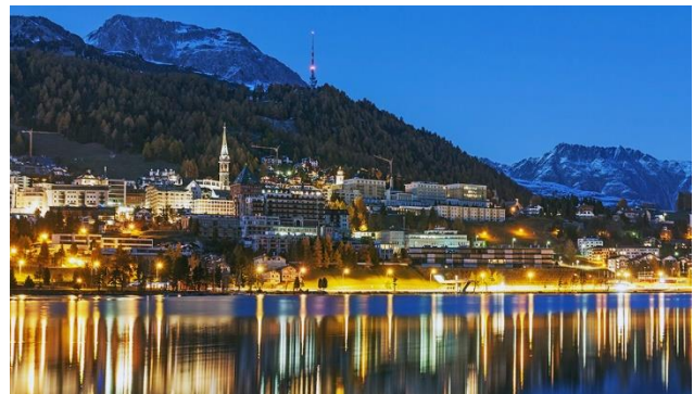
St. Moritz bei Abend