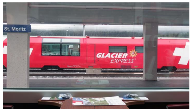
Einfahrt des Glacier Express in St. Moritz