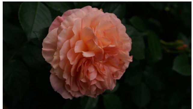
Jubiläumsrose im Europa-Rosarium Sangershausen