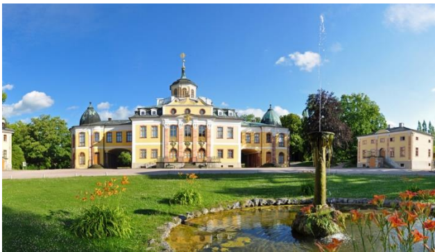
Schloss Belvedere in Weimar

Mehr als eine Blümchenschau erwartet die Besucher in Erfurt: Gartenkunst mit einer Blütenpracht und Pflanzenfülle in einem besondern Ausmass und Ambiente! Sie geniessen Ihren Aufenthalt in der Kulturstadt Weimar. Auf einem Tagesausflug machen Sie eine geführte Entdeckertour in den zwei grossen facettenreichen Ausstellungsparks der BUGA in Erfurt: dem geschichtsträchtigen Petersberg und dem schönsten Garten Thüringens, dem egapark. Sie lernen Weimar auf einer kurzweiligen Stadtführung näher kennen und können sich in die grösste Rosensammlung der Welt entführen lassen: dem Europa-Rosarium in Sangershausen.