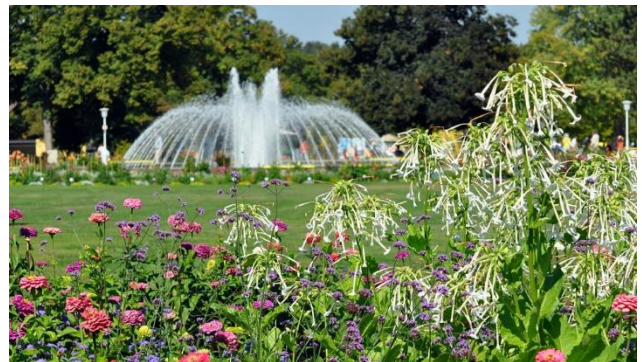
mit wunderschönen vielseitigen Parkanlagen