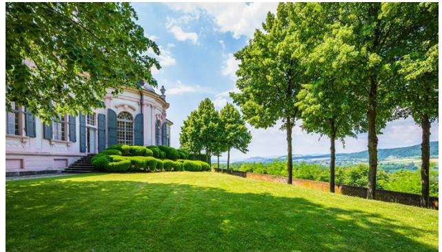
Gartenpavillion Stift Melk