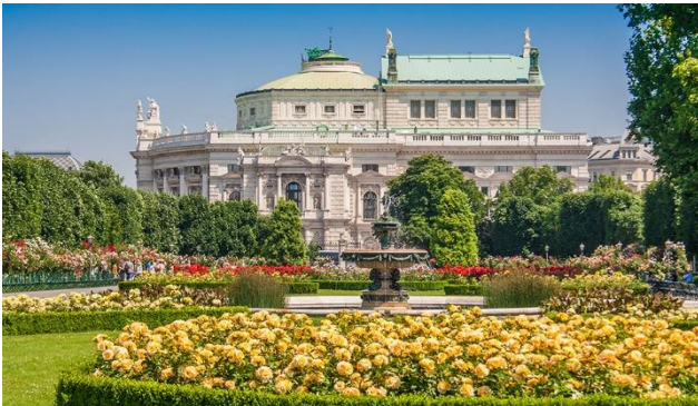
Rosenblüte im Wiener Volksgarten

Tauchen Sie ein in den Blütenzauber der Wiener Schloßgärten und in das historische Stadtzentrum von Wien, das zum UNESCO Weltkulturerbe zählt. Erleben Sie den inspirierenden Stiftspark in Melk, die Wachauer Herzlichkeit und die Schönheit der Donau auf dem Wasserweg.