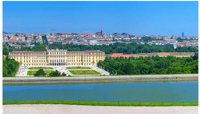
Der Klassiker - Schloss Schönbrunn