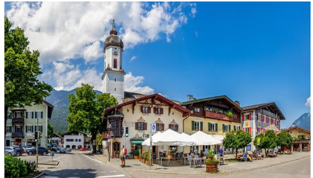
Traditionell und mondän – Garmisch-Partenkirchen