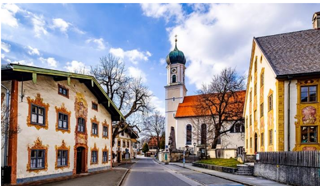
Oberammergau, welches für seine Passionsspiele bekannt ist.