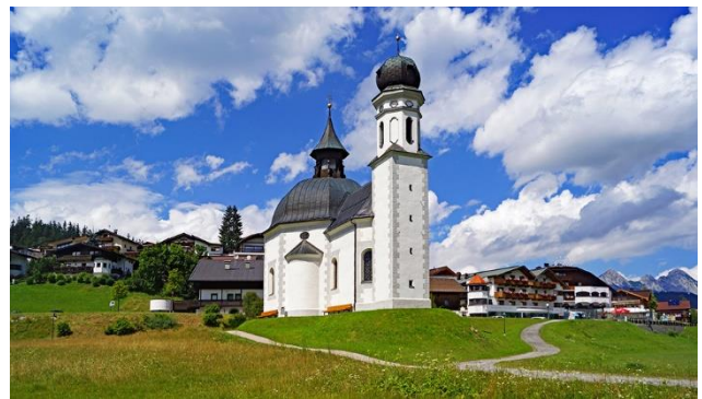
Das Seekirchl Heilig Kreuz in Seefeld