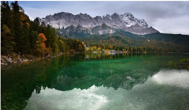
Der romantische Eibsee unterhalb der Zugspitze.

Garmisch-Partenkirchen wird Sie mit seiner Ursprünglichkeit, seiner Lebendigkeit und seinem Charme verzaubern. Der bekannte Skiort besteht aus zwei Ortschaften, welche 1935 vereint wurden. Während Garmisch als mondäner Ortsteil gilt, verströmt Partenkirchen mit seinen Strassen aus Kopfsteinplaster traditionell bayrisches Ambiente. Bei dieser Reise erfahren Sie mehr über diesen geschichtsträchtigen Kreishauptort und werfen einen Blick hinter die Kulissen der berühmten «Oberammergauer Passion». Auf fakultativen Ausflügen kommen Sie hoch hinaus zu den beiden Wahrzeichen der Ferienregion: die grosse Skisprungschanze und die Zugspitze.