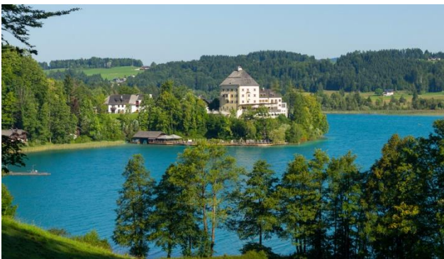
Jagdschloss in Fuschl am See

Fuschl am See – glasklar, blitzsauber und sich weit hinaus öffnend, breitet sich der Fuschlsee vor dem idyllischen Ort Fuschl am See aus. Der Ausblick von der Seepromenade auf die Berge und den See, lässt Herzen höherschlagen. In Kombination mit einer Salzkammergut-Rundfahrt mit Schifffahrt, einem Bergausflug sowie einer Ausfahrt in die Mozartstadt Salzburg ist diese Reise eine tolle Abwechslung zum Herbst-Alltag.