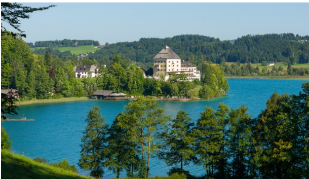
Jagdschloss in Fuschl am See

Fuschl am See – glasklar, blitzsauber und sich weit hinaus öffnend, breitet sich der Fuschlsee vor dem idyllischen Ort Fuschl am See aus. Der Ausblick von der Seepromenade auf die Berge und den See, lässt Herzen höherschlagen. In Kombination mit einer Salzkammergut-Seenrundfahrt mit Schiff und Bahn sowie einem Ausflug in die Mozartstadt Salzburg ist diese Reise eine tolle Abwechslung zum Herbst-Alltag.