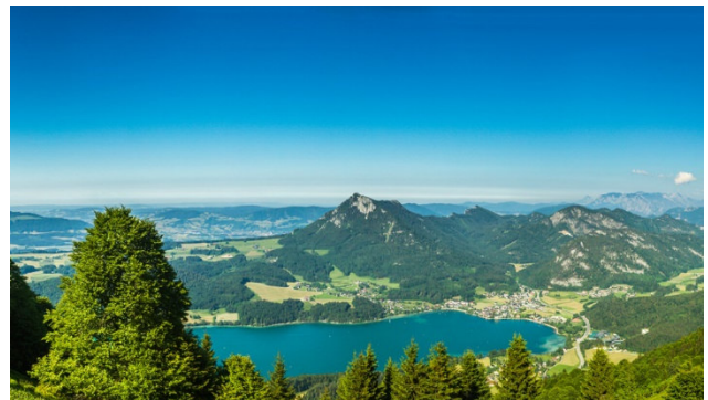
Salzburgerland mit dem Fuschlsee