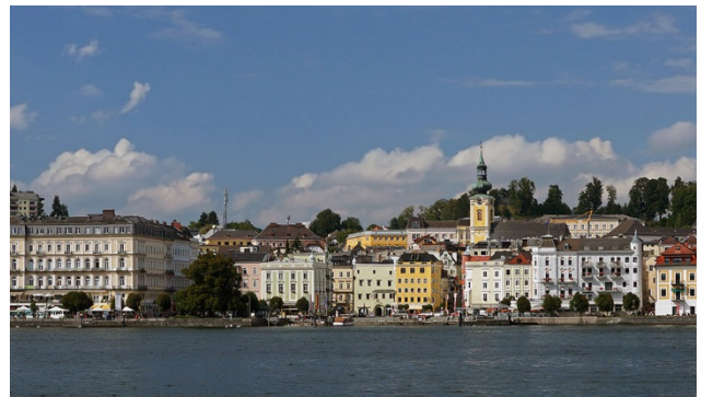
Gmunden mit dem Traunsee