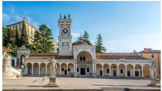
Udine im Herzen des Friauls gelegen