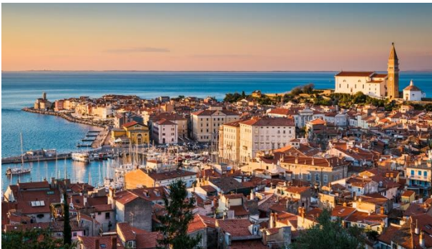
Piran an der slowenischen Riviera