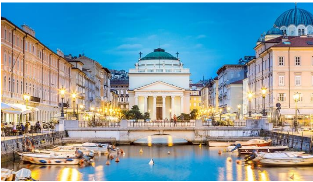
Der Canal Grande in Triest

Entdecken Sie mit uns Perlen der nördlichen Adria: Das Friaul reicht von der Adria, mit den bekannten Seebädern Grado und Lignano, bis zu den Karnischen beziehungsweise Julischen Kalkalpen. Im Norden mit seinen Dolomiten, gehört die Berglandwirtschaft und der Wintertourismus zu den Einnahmequellen der Bevölkerung, während es im Süden die ertragreichen Rebhänge und der Sommertourismus sind. Doch nicht nur die landschaftlichen Gegensätze machen diese Region sehenswert, sondern auch die verschiedenen kulturellen Einflüsse, gewachsen aus der bewegten Geschichte, werden Sie beeindruckend. Genießen Sie die herrliche Landschaft, die Gastfreundschaft der Einwohner und die köstlichen Spezialitäten von weltweiter Bekanntheit wie den Wein, den Kaffee und den Schinken. Sie wohnen während der ganzen Reise in einem schönen Hotel im Dorf Gradisca d'Isonzo. Von hier aus unternehmen Sie Ausflüge zu den Höhepunkten dieser schönen und zum Teil unterschätzten Region. Dabei darf auch ein Abstecher zur Slowenischen Riviera nicht fehlen.