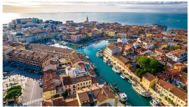
Grado an der Nordküste der Adria