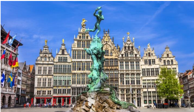
Grote Markt in Antwerpen

Als Flandern wird der nördliche Teil Belgiens, mit seinen niederländischsprachigen Flamen, bezeichnet. Alle der vier Kunststädte in Flandern – Gent, Antwerpen, Brügge und Brüssel – haben ihre eigene Geschichte, ihren eigenen Charakter und eine unverwechselbare Atmosphäre. Flandern ist aber nicht nur für seine Städte, sondern auch für seine feine Küche bekannt. Sympathische Lokale sowie schöne Geschäfte und Museen vermitteln den typisch flämischen Lebensstil. Freuen Sie sich auf diese eindruckliche Reise nach Belgien!