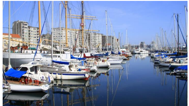
Hafen von Oostende