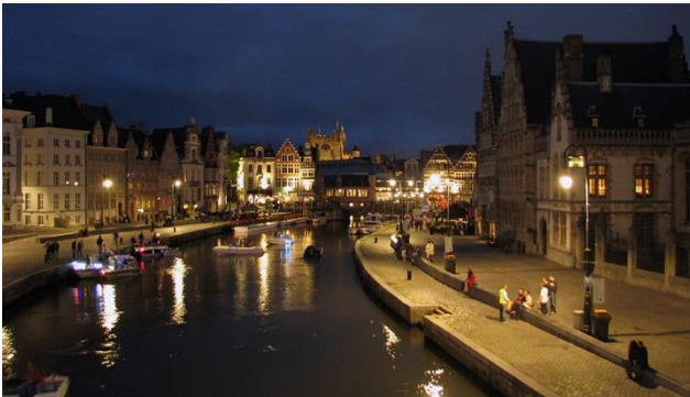
Gent bei Nacht