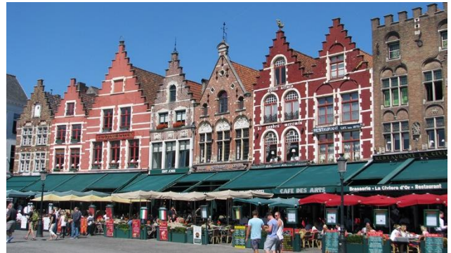
Grote Markt in Brügge