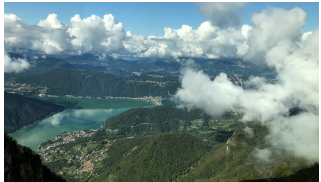
Aussicht vom Monte Generoso