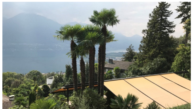
Aussicht aus Brione ob Locarno