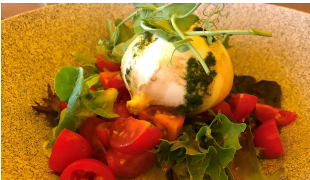
Feine Küche im Tessin

Das Tessin ist das Tor zum Süden. Es reizt vor allem mit seinem Charme, fasziniert mit Lifestyle und der italienischen Sprache. Jenseits der Alpen empfangen Sie mildes Klima, Palmen an idyllischen Stränden, liebliche Täler, romanische Kirchen und pittoreske Gassen, die sich auf belebte Plätze hin öffnen. Vergangenheit und Zukunft, Nord und Süd, Berg und Tal, Natur und Kultur, Stadt und Land – eine faszinierende Einheit voller Gegensätze.