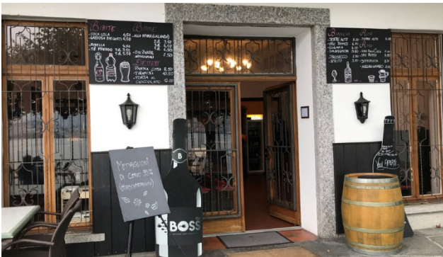
Typische Tessiner Lokalität