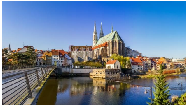
Kirche Peter und Paul in Görlitz