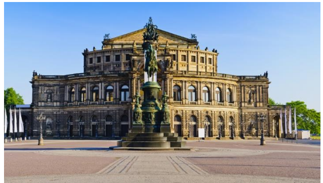
Dresden mit Semperoper