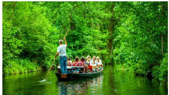
Stoherkahnfahrt im Spreewald