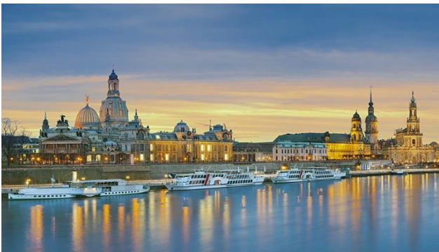
Skyline von Dresden

Die wunderschöne Elbmetropole Dresden begeistert als Gesamtkunstwerk. Lernen Sie zudem die Wiege Sachsens kennen: das über 1000-jährige Meissen, bekannt für edles Porzellan und ein mittelalterliches Stadtbild. Nicht weniger reizvoll ist das Wasserschloss Moritzburg. Lassen Sie sich zudem von Schloss und Park Pillnitz, dem aussergewöhnlichen Ensemble aus Architektur und Gartenkunst beeindrucken. Der Spreewald ist vor allem bekannt als Land der Gurken. Doch der Landstrich, in dem sich die Spree in hunderte von Wasserläufen verliert, hat weit mehr zu bieten als die knackig grünen Botschafter. Überzeugen Sie sich auf einer gemütlichen Kahnfahrt davon!