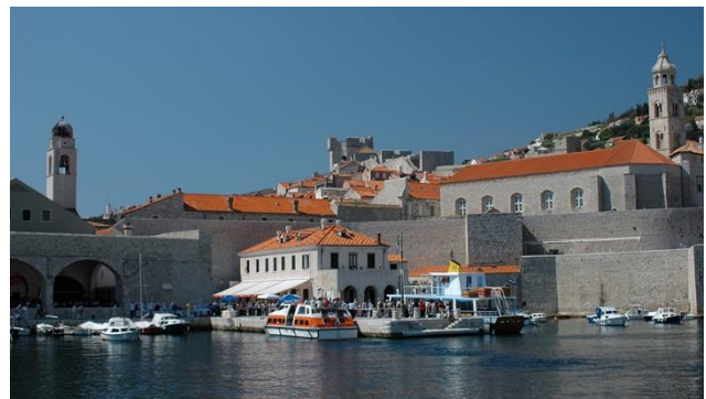
Dubrovnik an der Adria mit Hafenstadt