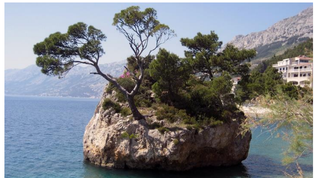
Makarska-Riviera mit Punta Rata Strand