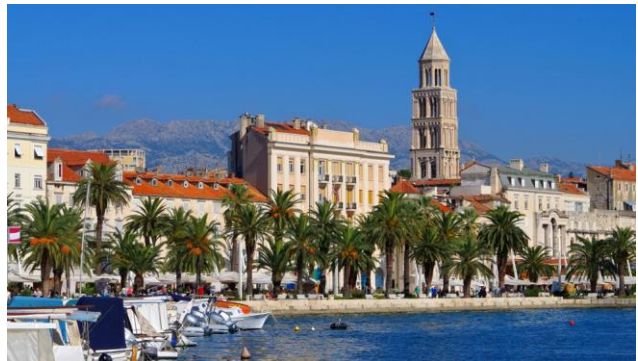
Split – die zweitgrösste Stadt Kroatiens