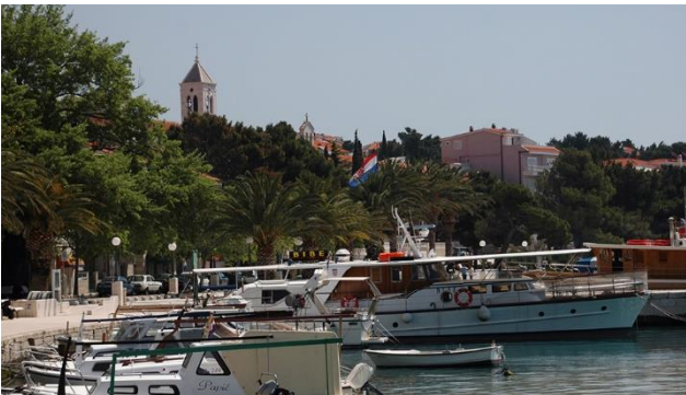
Makarska Riviera mit Brela

Rückkehr ins Hotel Marina nach Brela. Abendessen und Übernachtung.