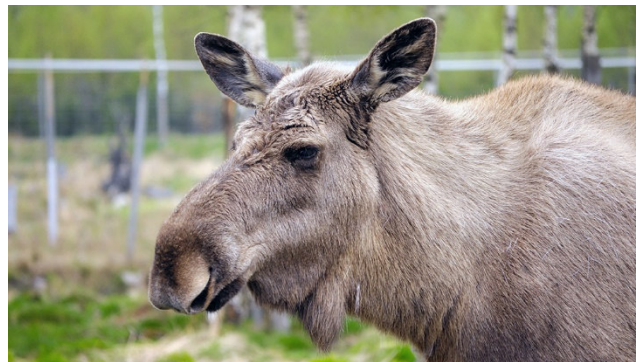
Könige der Wälder im Elchpark Elinge

■ Herrliche Landschaften ■ Kopenhagen und Stockholm ■ Fahrt auf dem Göta-Kanal