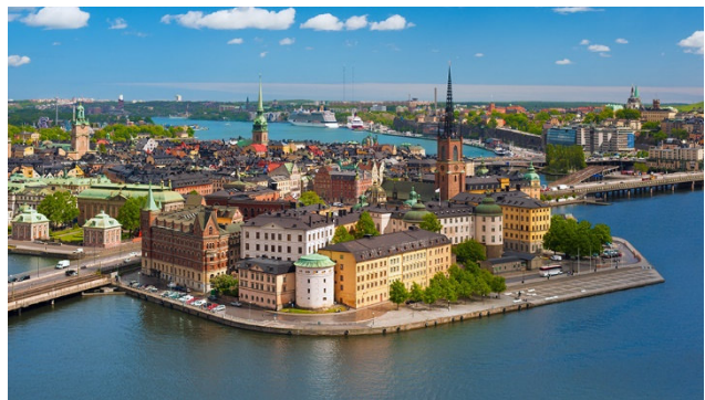
Schwedens Hauptstadt Stockholm