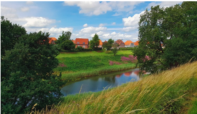
Dänische Landschaft um Frederica

Weiter erreichen Sie das Traumland von Inga Lindström. Die Reise führt Sie zu den schönsten Ecken Südschwedens – immer unterwegs entlang tiefblauer Seen und durch wunderschöne Landschaften mit grünen Wiesen und typisch rot-weißen Holzhäuschen. Mit Stockholm, dem Venedig des Nordens und eine Fahrt auf dem historischen Göta-Kanal von Borensberg nach Motala mit spektakulären Wasserschleusen runden diese besondere Reise ab.