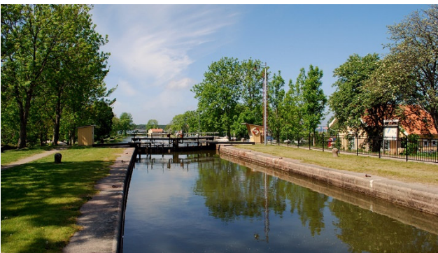
Auf dem Göta-Kanal

Auf einer Stadtführung lernen Sie die Hauptstadt kennen – Sie werden begeistert sein: Die kleine Meerjungfrau ist kleiner, die Fussgängerzone Strøget ist länger, der Vergnügungspark Tivoli ist älter und Amalienborg imposanter als Sie vermuten. Abendessen und Übernachtung im Hotel Absalon, ein typisches Stadthotel zentral im Herzen von Kopenhagen gelegen.