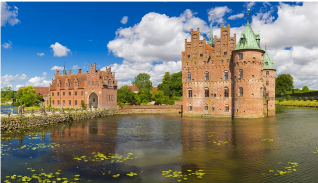
Schloss Egeskov in Dünemark

Die Dänen verstehen es, sich in netter Gesellschaft gemütlich zu machen und das Leben zu genießen. „Hygge“ wird dieser Teil des dänischen Lebensstils genannt. Die Umgebung tut ihr Übriges. Egal wo in Dänemark Sie sich aufhalten, Sie sind nie weiter als 50 Kilometer vom Meer entfernt. Dänemarks Natur ist unberührt und leicht zugänglich und weist eine enorme Küstenlänge von über 7 300 Kilometern auf. Das wundervolle Kopenhagen hat eine Menge grossartiger Sehenswürdigkeiten zu bieten und auch kleinere Städte wie das historische Ribe, Esbjerg, Odense und die Sonneninsel Bornholm haben wunderbare Sehenswürdigkeiten.