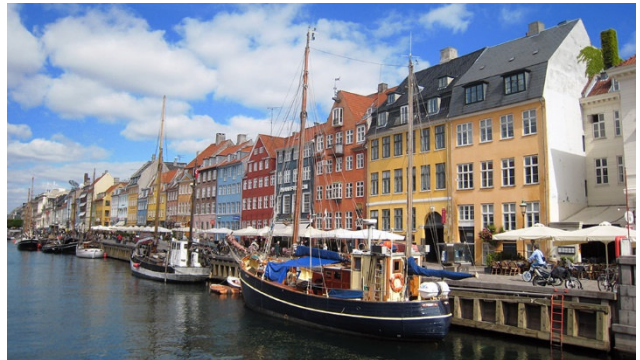
Nyhaven in Kopenhagen