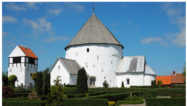
Rundkirche von Nylars auf der Insel Bornholm