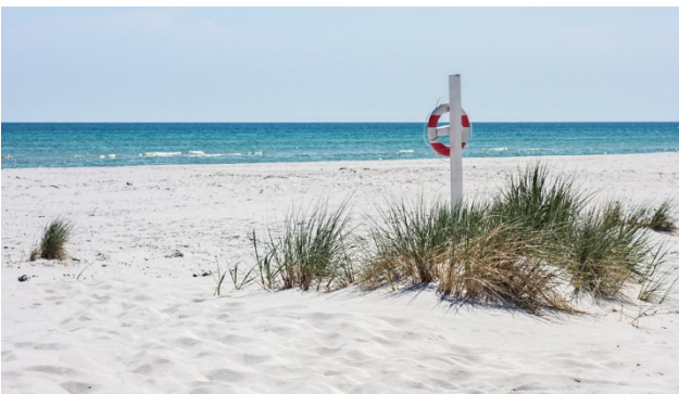
Doedde Stand auf der Insel Bornholm