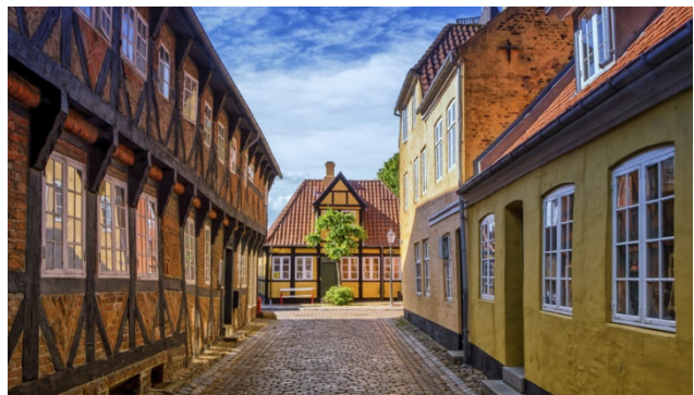
In den Gassen von Ribe