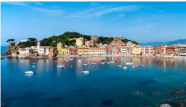
Sestri Levante – Ihr Ferienort aus Seesicht