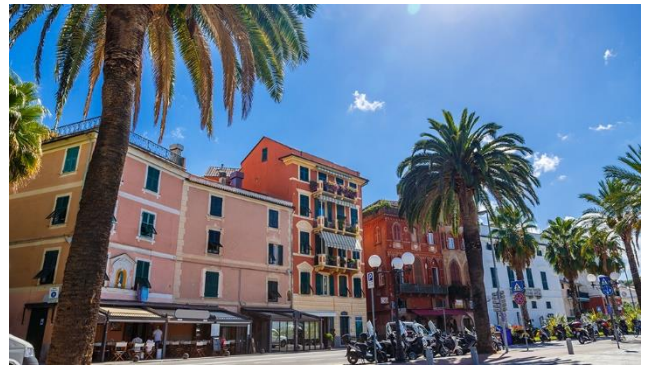
Bunte Strassen von Sestri Levante