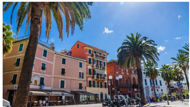
Bunte Strassen von Sestri Levante