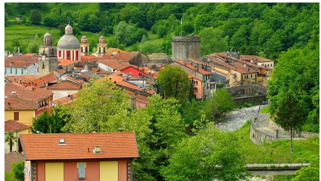
Varese Ligure – das umweltfreundliche Genuss-Tal