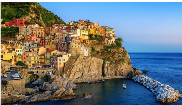
Manarola – das Typische Bild der Cinque Terre

Ein Naturspektakel bietet dieser malerische Küstenabschnitt Liguriens: Meer, Berge und steile Felsen. In der wildromantischen Cinque Terre kleben die Häuser förmlich an und auf den Felsen. Eine intakte und üppige Natur finden Sie im Valle del Biologico. Atemberaubende Aussichten auf Meer und Stadt geniessen Sie im Belle Epoque Zug. Das Küstenstädtchen Sestri Levante hat seinen ganz eigenen Charme: pittoreske kleine Gassen, bunte Hausfassaden, traditionelle Läden und Fischerboote.