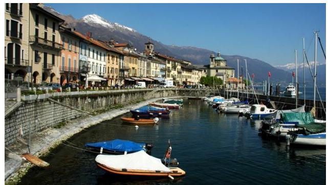
Strandpromenade in Cannobio