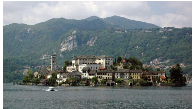
Ortasee mit Insel San Giulio