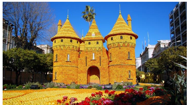
Überwältigendes Farbenmeer am Zitronenfest in Menton