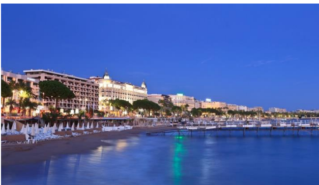
Romantische Abendstimmung an der Blumenriviera – Cannes

An der zauberhaften Blumenriviera erleben Sie den Frühlingsanfang und erliegen dem mediterranen Charme von Cannes. Der Badeort ist vor allem bekannt wegen der jährlich statt findender Filmfestspiele, wo jeweils die Goldene Palme verliehen wird. Hier finden Sie nebst dem bekannten Kongresspalast aber auch schöne Fussgängerzonen mit Feinkostgeschäften und einen Hafen, wo sich historische Segelschiffe und Yachten dümpeln. Freuen Sie sich auf zwei Ausflüge voller farbiger Eindrücke. Beim weltbekannten Karneval von Nizza geht es fröhlich und bunt zu und her. Frühlingsfrische erleben Sie nur schon visuell beim legendären Zitronenfest in Menton mit seinen riesigen Figuren mit vielen tausenden Zitrusfrüchten.