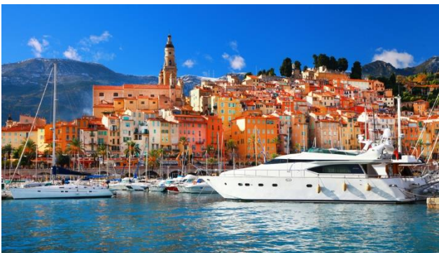
Bezaubernde Hafenstadt Menton