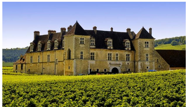
Schloss Clos de Vougeot