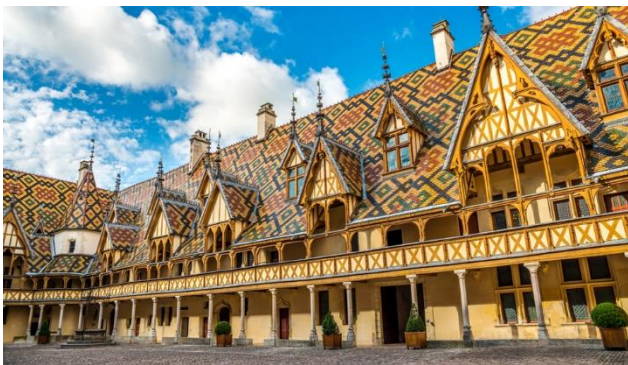
Hospital Hôtel-Dieu in Beaune

Das Burgund, bekannt für seine Spitzenweine, besitzt neben den Rebbergen eine fruchtbare, liebeliche Landschaft. In Beaune und Dijon lernen Sie weitere erlesene Köstlichkeiten der Region kennen. Zahlreiche Klöster und prachtvolle Schlösser sind Zeugen einer reichen Geschichte. Kommen Sie mit auf kulturelle und kulinarische Entdeckungsreise!