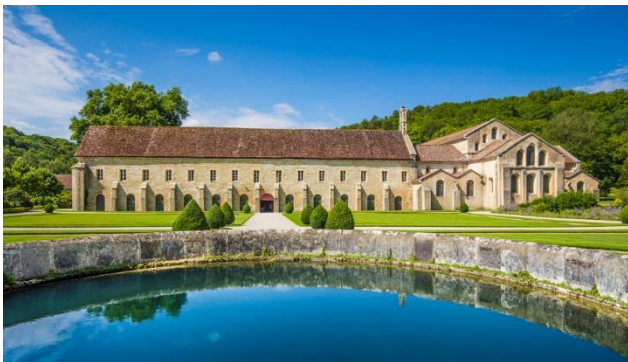
Montbard, Abtei Fontenay