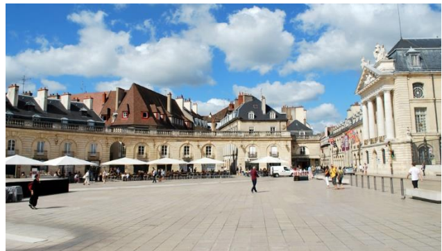
Dijon, Place de la Liberation