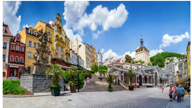
Innenstadt von Karlsbad