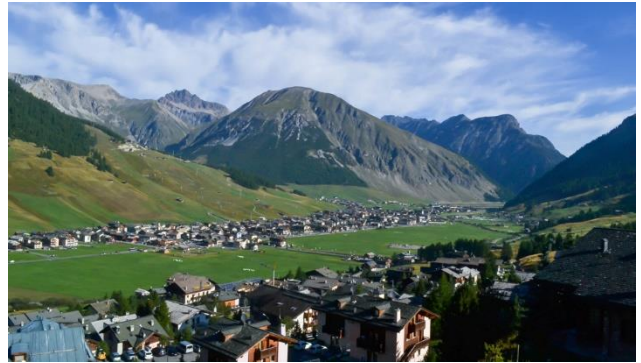
Livigno mit italienischen Alpen