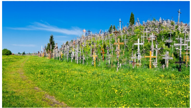
Berg der Kreuze – das nationale Symbol des Widerstandes