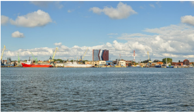
Hafenstadt Klaipėda in Litauen

Lange im Dornröschenschlaf, entpuppen sich die baltischen Staaten und holen mit Riesenschritten in Wirtschaft und Tourismus gegenüber dem alten Europa auf. Umso interessanter ist es, sich in diesem neuen Europa umzusehen – und mächtig zu staunen. Ihre historischen Städte weisen individuellen Charme auf und die ländlichen Gegenden haben viel zu bieten: Kilometerlange, feine Sandstrände, die idyllische Kurische Nehrung, romantische Inseln in Estland, mittelalterliche Orte, malerische Dörfer und imposante Burgen.