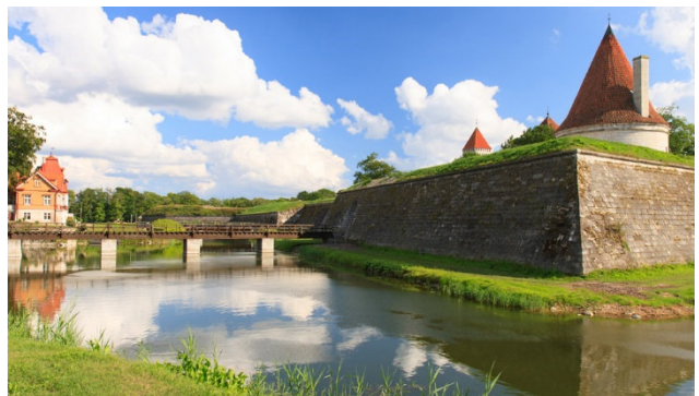
Insel Saaremaa – Kuressaare Schloss