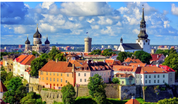
Tallinn die Hauptstadt Estlands

Man sollte Litauen nicht verlassen, ohne den Berg der Kreuze bei Siauliai, das nationale Symbol des Widerstandes, besucht zu haben. Weiterfahrt nach Riga, der grössten Stadt des Baltikums. Sie lernen auf einem geführten Stadtrundgang die Perle des Baltikums kennen. Sie sehen die Altstadt mit ihren verwinkelten Gassen, den Rathausplatz mit dem Rathaus und dem Schwarzhäupterhaus und den Dom. Keine Hauptstadt der Welt besitzt so viele Jugendstilbauten wie Riga. Wohin man schaut, filigrane Gesichter, Tiere, Blumen und üppige Ornamente vom Erdgeschoss bis zum Dach. Abendessen und Übernachtung im Hotel Radisson Blu Elizabete Riga.