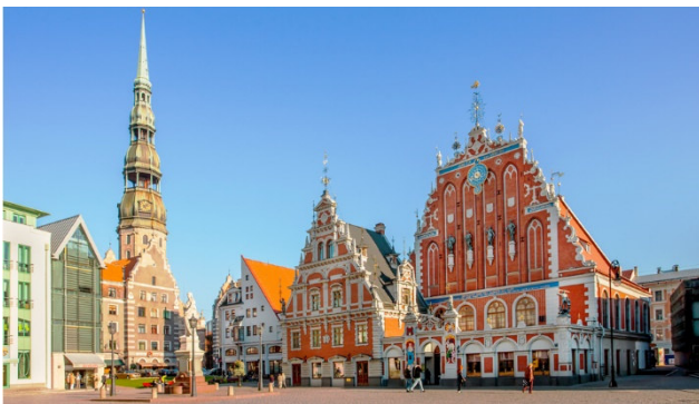
Riga – die Perle des Baltikums