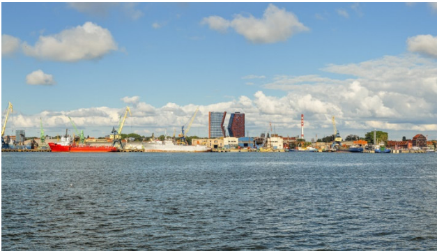
Hafenstadt Klaipėda in Litauen

Lange im Dornröschenschlaf, entpuppen sich die baltischen Staaten und holen mit Riesenschritten in Wirtschaft und Tourismus gegenüber dem alten Europa auf. Umso interessanter ist es, sich in diesem neuen Europa umzusehen – und mächtig zu staunen. Ihre historischen Städte weisen individuellen Charme auf und die ländlichen Gegenden haben viel zu bieten: Kilometerlange, feine Sandstrände, die idyllische Kurische Nehrung, romantische Inseln in Estland, mittelalterliche Orte, malerische Dörfer und imposante Burgen.