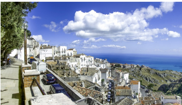
Monte Sant-Angelo auf der Gargano Halbinsel

Apulien, der Absatz des italienischen Stiefels, vermittelt unvergessliche Eindrücke: Normannische Mosaikkunst, barocke Kirchenfassaden, märchenhafte Tropfsteinhöhlen, die einzigartigen «Trulli», so genannte runde Häuser in Alberobello sowie wehrhafte Kastelle, allen voran das Castel del Monte des Stauferkaisers Friedrich II., der von hier aus das Heilige Römische Reich Deutscher Nation regierte. Die Gargano-Halbinsel ragt wie ein Sporn aus dem italienischen Stiefel. Der weite Horizont, die tiefen und geheimnisvollen Wälder und die zerklüftete und einsame Küste bilden eine fantastische Kulisse.