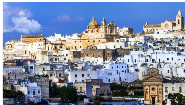
Weisse Stadt Ostuni