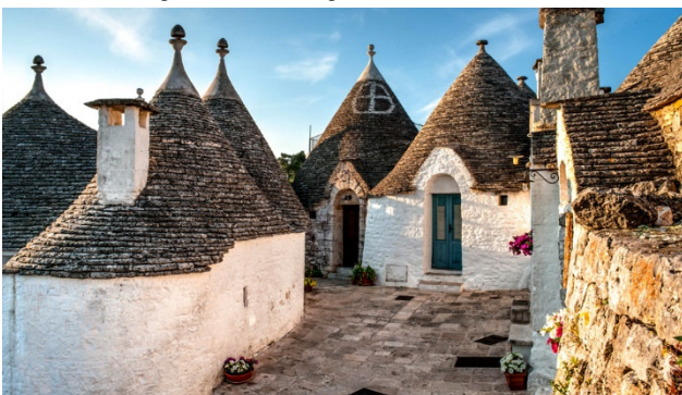
Weisse Trulli in Alberobello