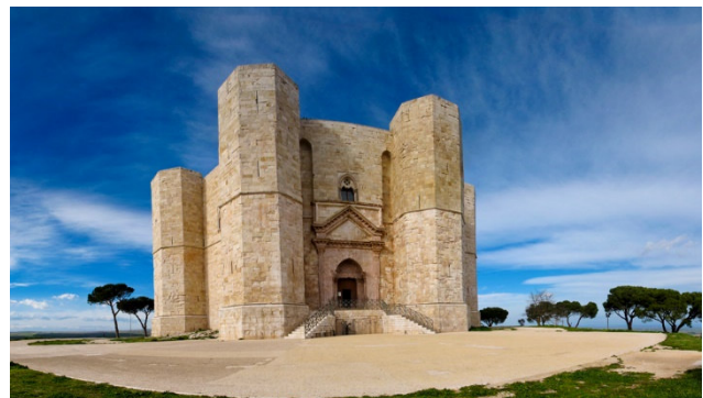
Geheimnisvolle Castel del Monte