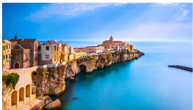
Gargano Halbinsel mit Blick aufs Meer