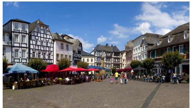
Linz am Rhein