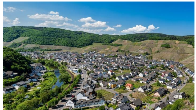
Das Ahrtal mit seinen Steillagen der Weinberglandschaft