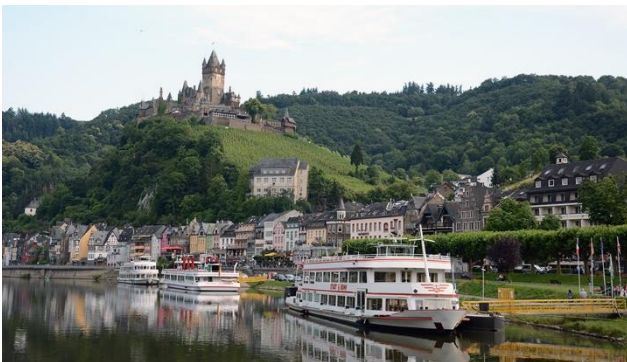
Cochem an der Mosel