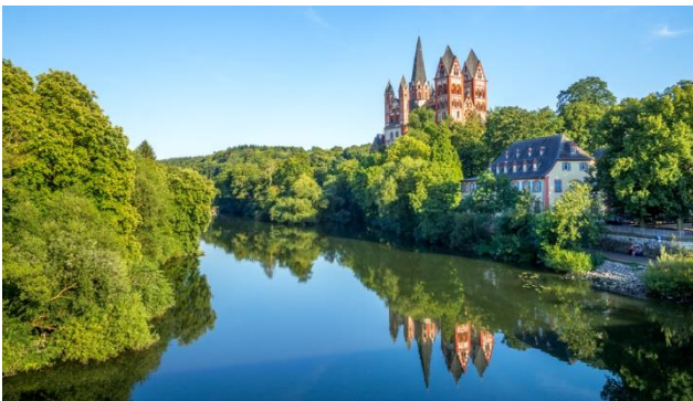
Limburg an der Lahn

Kommen Sie mit uns an den idyllische Rhein, an die Mosel und ins Ahrtal, das durch seine Weine weltweit bekannt wurde. Der Rhein, einer der landschaftlich schönsten Flüsse Europas, malerische Weindörfer, mittelalterliche Burgen sowie altertümliche Städtchen gestalten hier die Landschaft sehr abwechslungsreich. Mit 89 Kilometer Länge klein, aber fein, ist das Ahrtal erstaunlich vielfältig. Landschaftlich reicht das Spektrum von sanften Hügeln über schroffe Felsen und romantische Flusssauen bis hin zu den Steillagen der Weinberglandschaft der Ahr. Die Mosel-Region begrüßt Sie mit einem der reizvollsten Flusstäler Europas und Deutschlands ältester Weinregion.