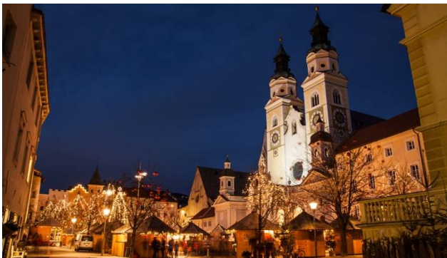
Weihnachtsstimmung in Brixen