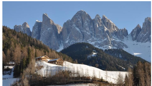
Geislerspitzen der imposanten Dolomiten