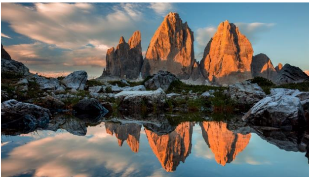
Die Drei Zinnen