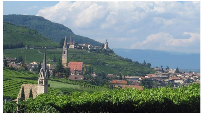
Weinregion Kaltern mit Tramin

■ Übernachtung im familiengeführten Wohlfühlhotel