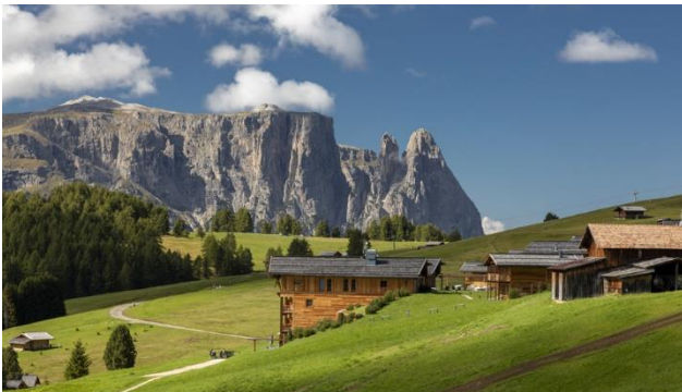
Europas grösste Hochalm – Seiser Alm