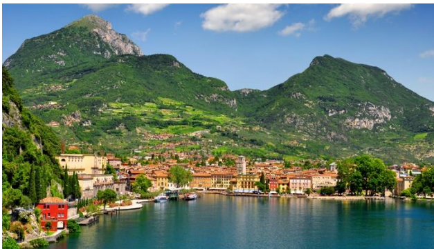
Riva del Garda am Gardasee