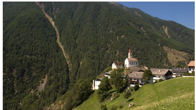
Katharinaberg im Schnalstal