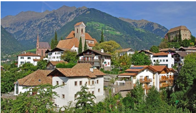
Schenna, der Sonnenhügel oberhalb Meran

Wenn es im April auf den Gipfeln noch schneit, treffen Sie im Südtirol bereits mitten auf den Frühling! Das ganze Tal ist ein Blütenmeer. Jetzt ist die schönste Zeit, die frische Alpenluft in romantischen Städten und Dörfern zwischen blühenden Bäumen und buntgetupften Blumenwiesen zu genießen.