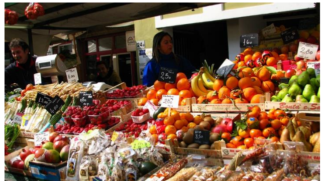
Obstmarkt in Bozen