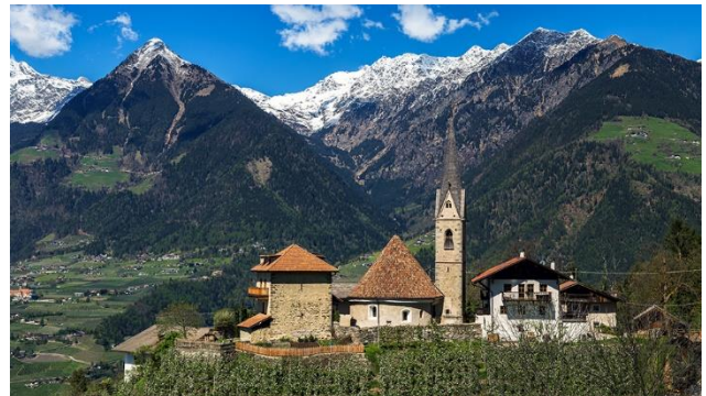
mit Rundkirche St. Georgen