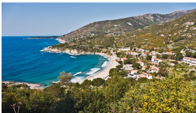
Marina di Campo