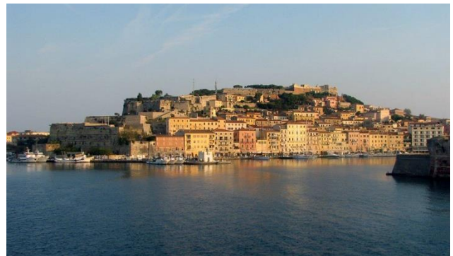
Abendstimmung in Portoferraio