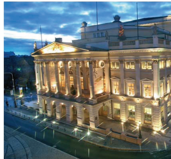
Das Opernhaus Breslau