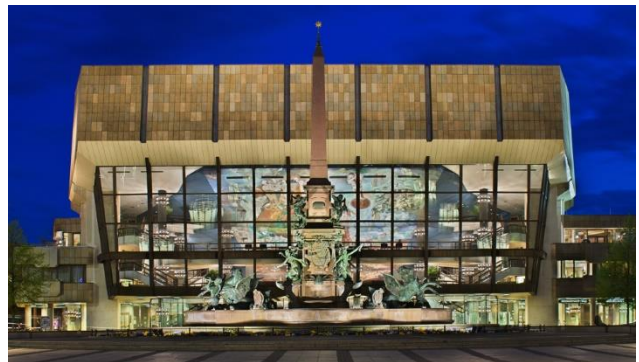
Gewandhaus in Leipzig