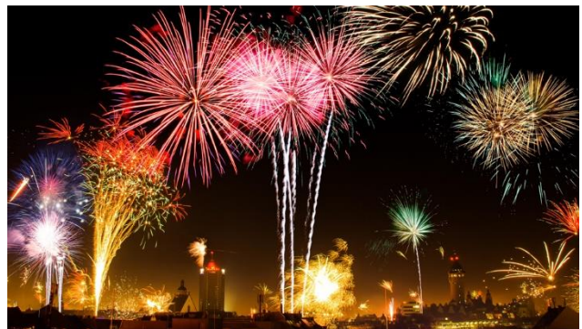
Frohes Neues Jahr!