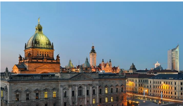
Panorama Skyline Leipzig

Die Stadt Leipzig blickt auf eine fast tausendjährige Geschichte zurück, mit kultureller Vielfalt, die ihresgleichen sucht. Egal ob Musik, Theater, Architektur oder Kunst, der Facettenreichtum Leipzigs begeistert seine Besucher stets aufs Neue.