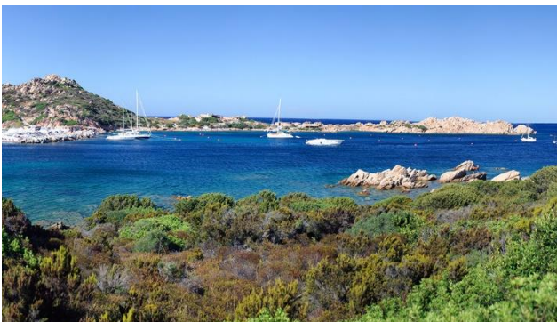
Smaragdgrünes Meer bei der Isola Maddalena