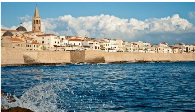
Faszinierende Hafenstädte – Alghero

Geniessen Sie auch den Besuch in vielen besonderen Dörfern und Städten wie: Alghero an der Westküste, auch als Korallenstadt bekannt, Orgosolo mit seinen «murales» oder Orosei mit barocker Kirche, schöner Piazza im «centro storico» und den wunderschönen Stränden Cala Liberotto und Cala Ginepro.