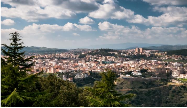
Panorama mit Nuoro