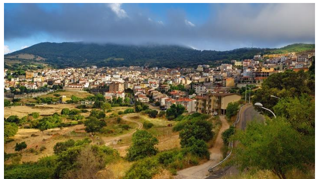
Städte zwischen Hügellandschaften – Orgosolo