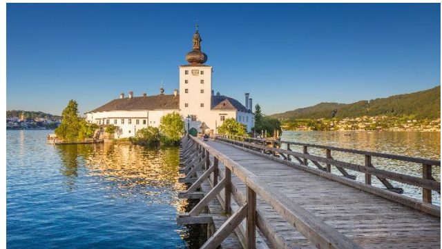
Schloss Ort in Gmunden am Traunsee