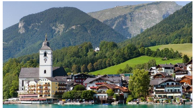
St. Wolfgang am Wolfgangsee