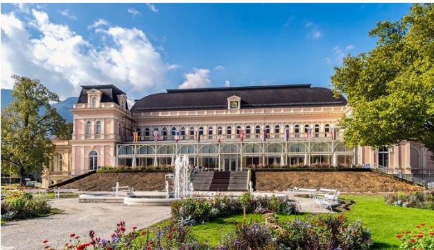
Kurhaus Bad Ischl