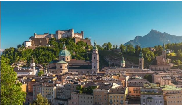
Panorama von Salzburg

Ein faszinierendes Zusammenspiel von Wasser- und Bergwelt bietet die Seenlandschaft vom Salzkammergut mit Mondsee, Attersee, Traunsee und Wolfgangsee, um nur die wichtigsten der 76 Seen in der Region zu erwähnen. Neben den landschaftlichen Schönheiten lernen Sie auch die weltberühmte Unesco Stadt Salzburg mit ihrer prächtigen Altstadt kennen und besuchen (fakultativ) das Flugzeugmuseum Hangar-7.