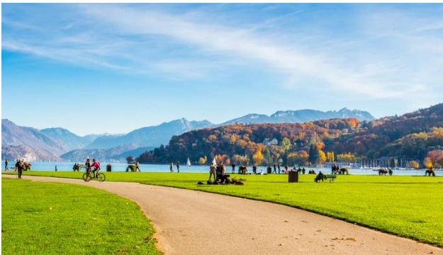
Alpsee mit schönem Panorama

Kommen Sie mit auf eine Fahrt ins Blaue! So viel sei schon verraten: „Blau“ wird öfters in Verbindung gebracht mit Wasser. So darf auf dieser Reise auch eine kleine Schifffahrt nicht fehlen. Zudem geht es mit dem Car auch mal den einen oder anderen See entlang. „Se(i)en“ Sie also gespannt! Sie lernen eine schöne Stadt am See kennen, wo Sie auch gastieren werden.