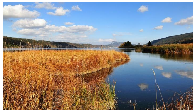
«Machen Sie einfach mal blau»!