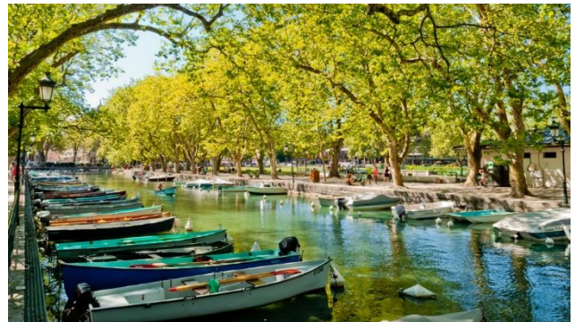
Zurücklehnen und ...