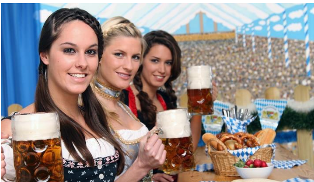
Bier und Brezel

Das Oktoberfest ist weltberühmt und man sollte es einfach einmal gesehen haben, denn die Stimmung ist fantastisch! Jedes Jahr aufs Neue ist das Oktoberfest „d’Wiesn“, ein Fest der Superlative. Als grösstes Volksfest der Welt, ist es ein riesiger Publikumsmagnet und beschert München, aber auch Bayern und Deutschland ein hohes Ansehen. Die Besucherzahlen liegen regelmässig zwischen 6 und 7 Millionen Besucher pro Jahr.