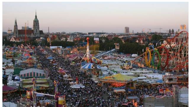
am Oktoberfest in München