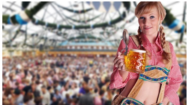
Diverse Trachten sind am Oktoberfest zu bestaunen