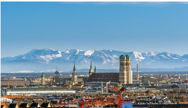
München – die bayrische Hauptstadt