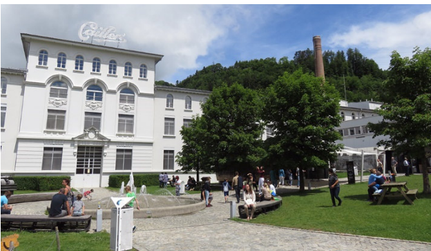
Schokoladenfabrik – Maison Cailler in Broc