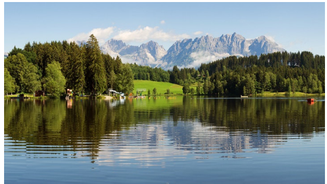
Der idyllische Schwarzsee