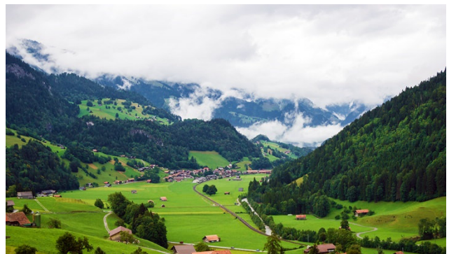
Boltigen am Fusse des Jaunpasses