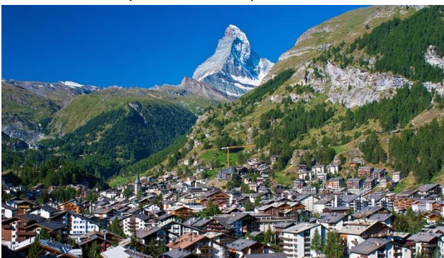
Der Glacier Express endet beim Matterhorn.