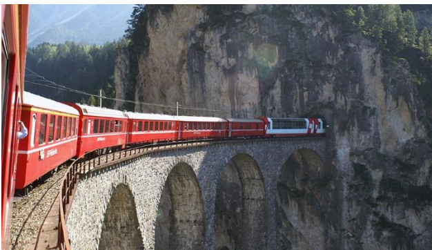
Mit dem Glacier Express durch die Alpenwelt.

Auf grosser Fahrt mit dem bekannten Glacier Express entdecken Sie tiefe Täler, donnernde Gebirgsbäche und längst vergessene Burgen. Bewundern Sie die einzigartige Gebirgslandschaft der Schweizer Alpen auf dieser eindrucksvollen Bahnfahrt von St. Moritz nach Zermatt, vorbei an landschaftlichen Höhepunkten und touristischen Attraktionen. Die „berühmteste Bahn der Welt“ überquert dabei 291 Brücken und 91 Tunnel – hier ist eindeutig die Reise das Ziel.