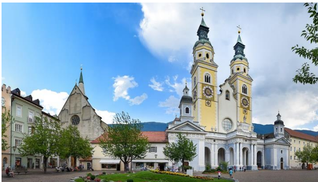
Dom in Brixen